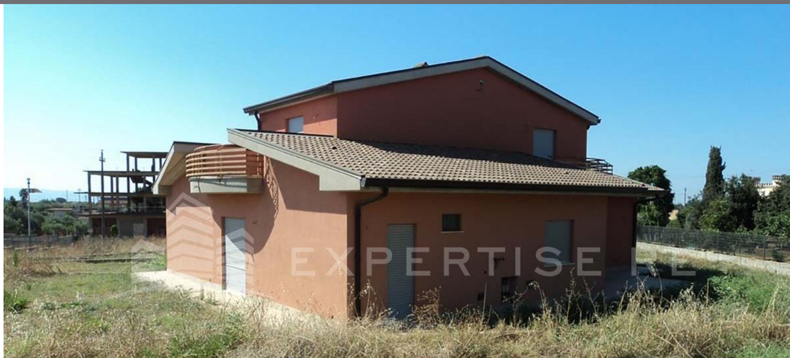
Caltagirone, villa unifamiliare all'asta (Lotto 11)